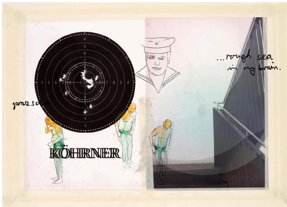
Tom Gefken - Rough Sea 50 x 70 - Mischtechnik auf Papier