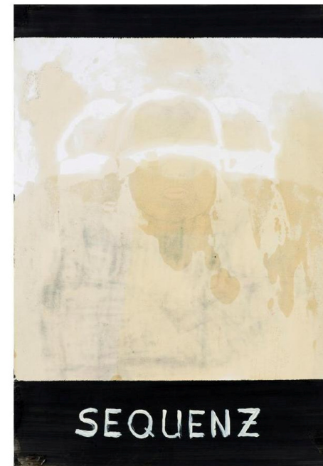
Tom Gefken - SEQUENZ 61 x 42 - Öl auf Papier