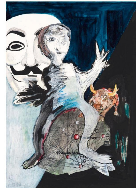
Achim Locke - BLACKROCK 58,2 x 41,6 - Mischtechnik